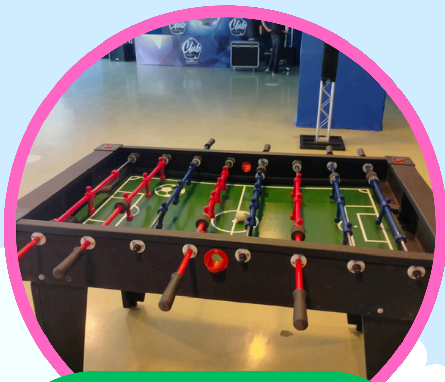
MESA DE PEBOLIM TOTÓ 0,89ALT X 1,17LAR X 1,36COMP