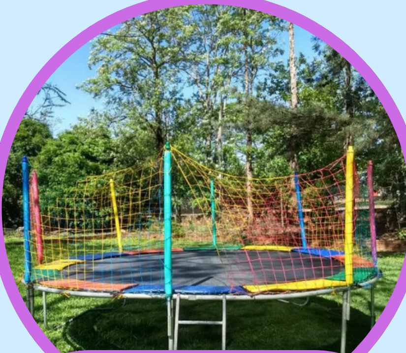
CAMA ELASTICA GRANDE 3ALT X 4,3LAR X 4,3DIAM