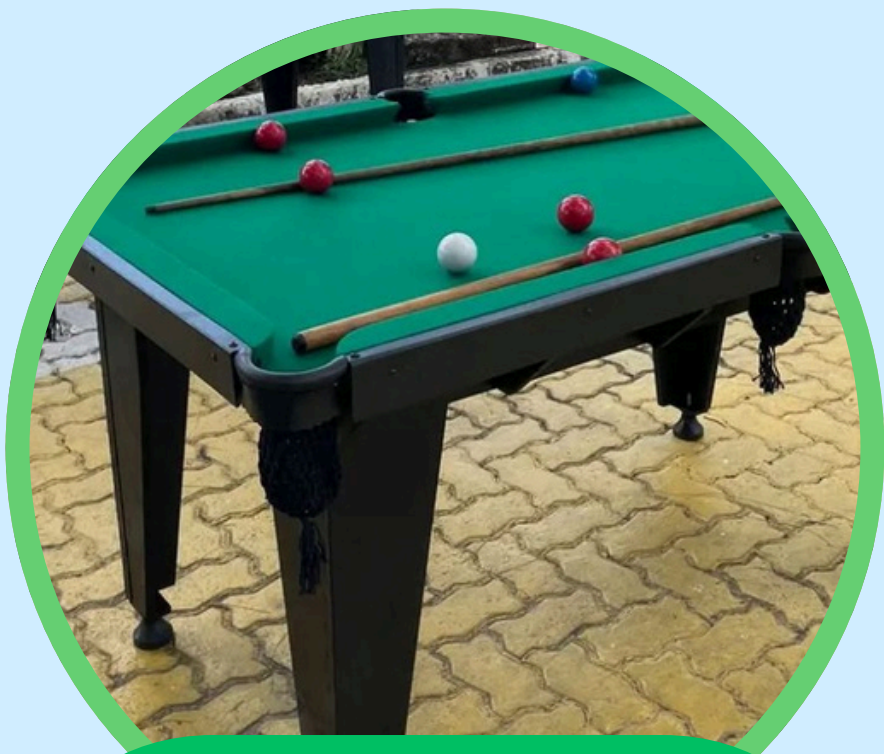
MESA DE SINUCA 0,90ALT X 1,13LAR X 1,83COMP