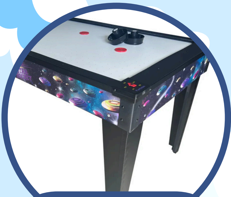
MESA AERO HOCKEY 0,85ALT X 0,80LAR X 1,43COMP