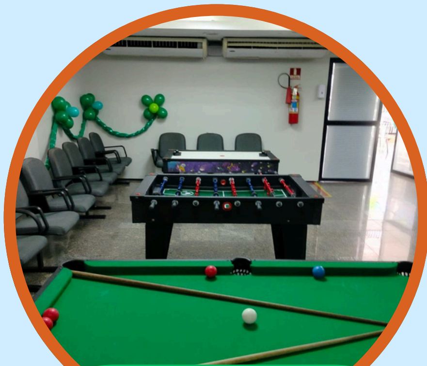
KIT 3 MESAS JUNTAS