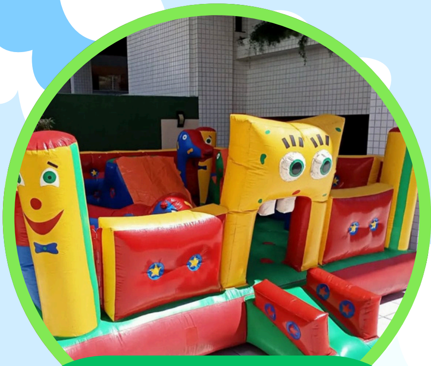
KID PLAY BOB ESPONJA 2,5ALT X 5LAR X 5COMP