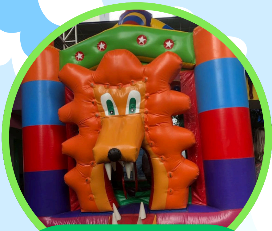
CASTELO LEÃO 4,5ALT X 3,5LAR X 3,5COMP