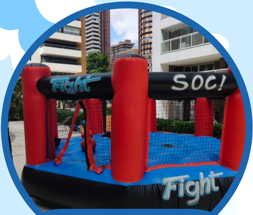
GUERRA DE COTONETES 2,5ALT X 4LAR X 4DIAM