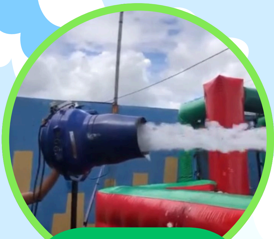
FUTEBOL/VOLÊI 2EM1 10,5COMP X 5LAR X 2,5ALT