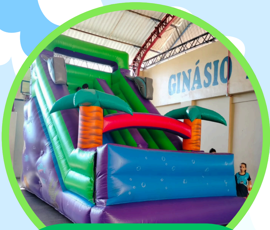
TOBOGÃ GOLFINHO SEM AGUA 5,5ALT X 3,5LAR X 5COMP