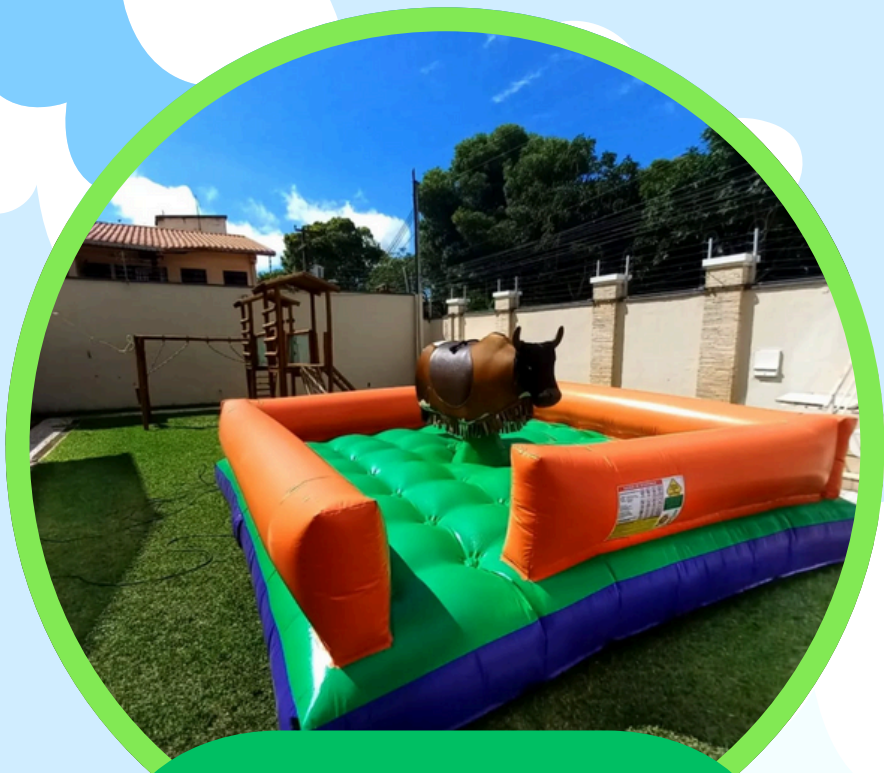
TOURO COMPACTO 4,2LAR X 4,2ALT