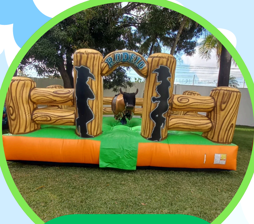
TOURO RODEIO 5LAR X 5ALT