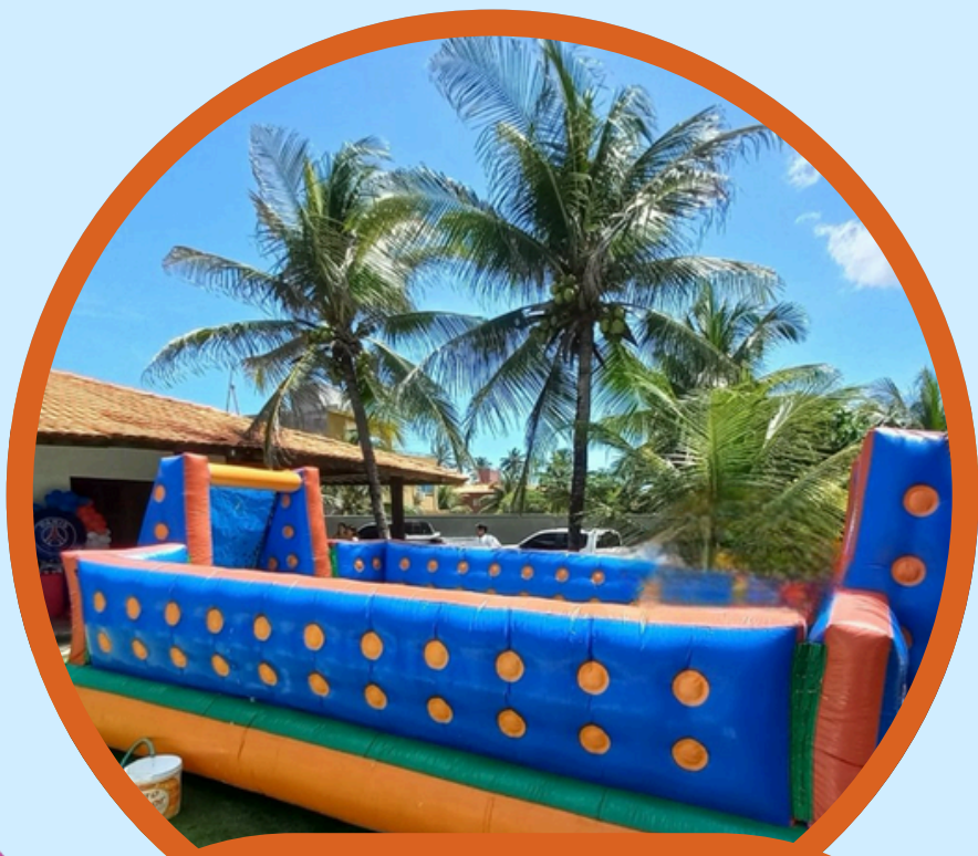
FUTEBOL COMPACTO 8,0COMP X 4,0LAR X 2,5ALT