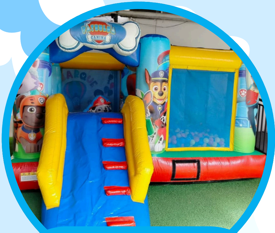
KID PLAY PATRULHA CANINA 2ALT X 3LAR X 3,5COMP