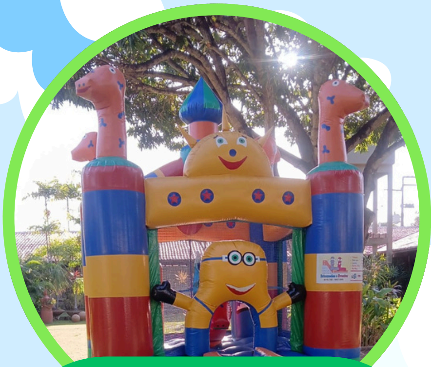
CASTELO MINIONS 4,5ALT X 3,5LAR X 3,5COMP