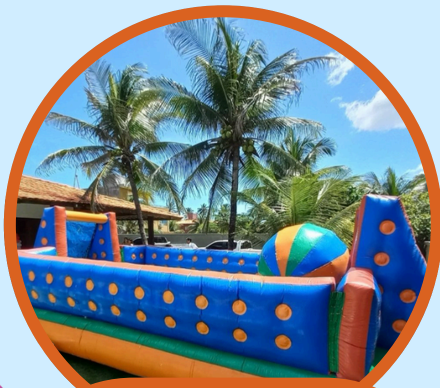
FUTEBOL COMPACTO 8,0COMP X 4,0LAR X 2,5ALT