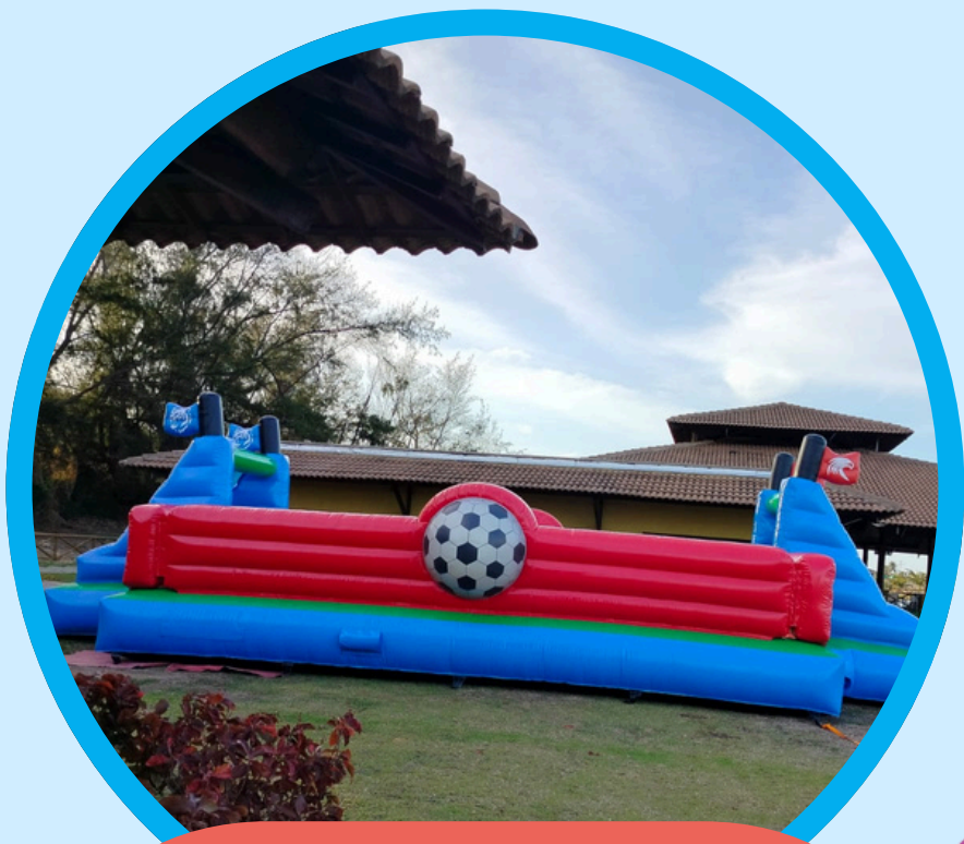
FUTEBOL MEGA 11,2COMP X 6,2LAR X 3,0ALT