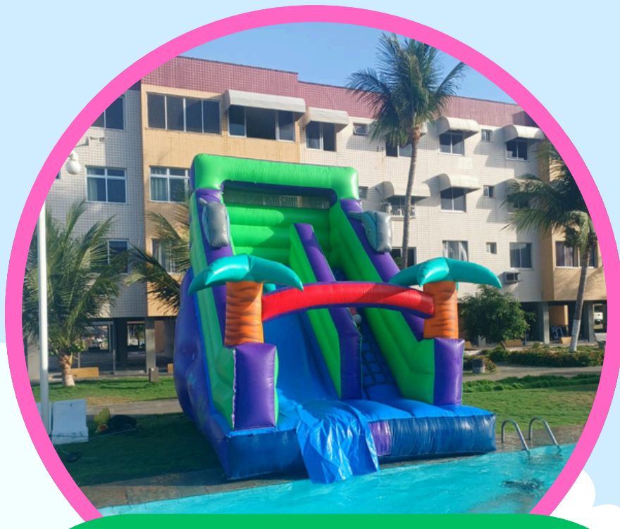
TOBOAGUA GOLFINHO SEM PISCINA SPLASH 5,5ALT X 3,5LAR X 5COMP