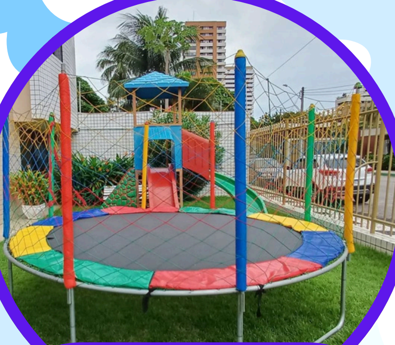
CAMA ELASTICA MÉDIA 3ALT X 3LAR X 3DIAM