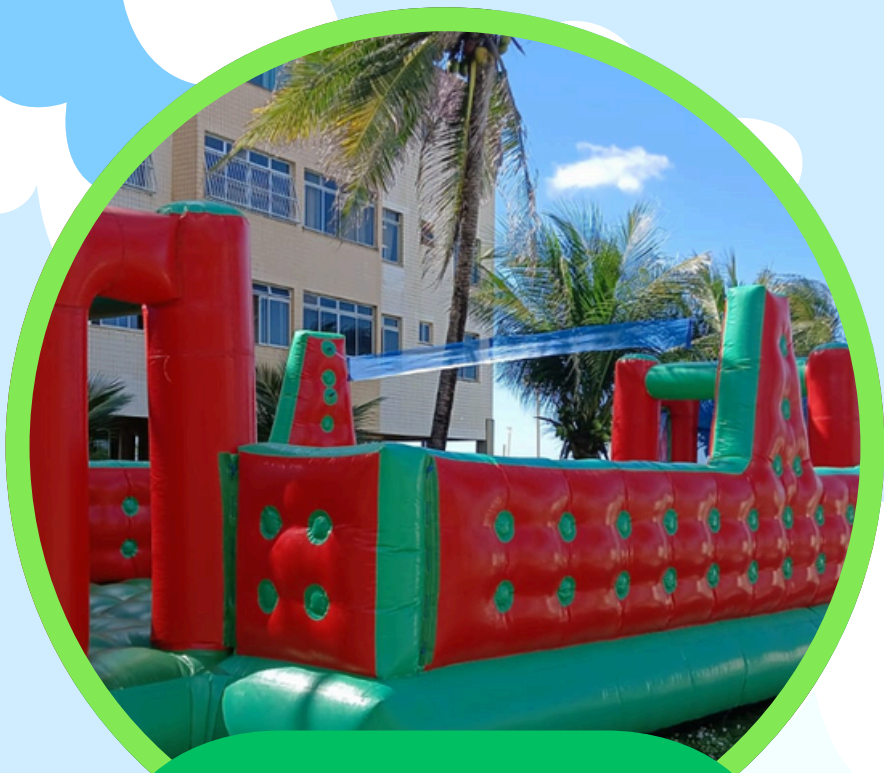
FUTEBOL/VOLÊI 2EM1 10,5COMP X 5LAR X 2,5ALT