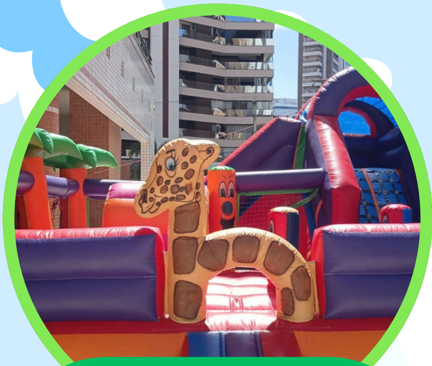
KID PLAY SAFARI MULTIATIVIDADES 4ALT X 6LAR X 6COMP