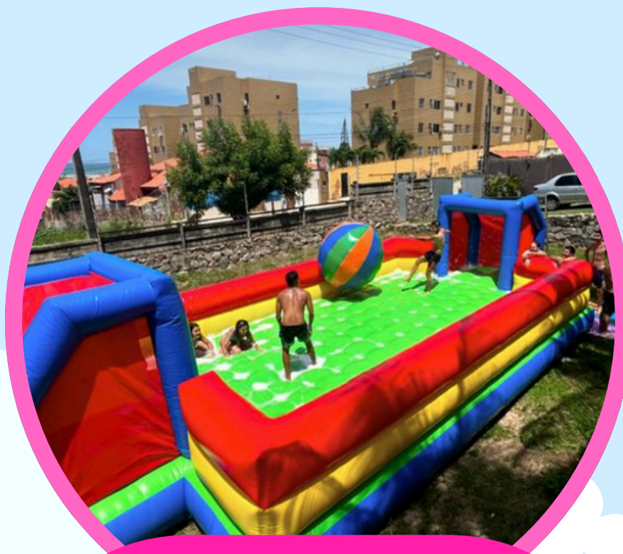
FUTEBOL 10,5COMP X 5LAR X 2,5ALT