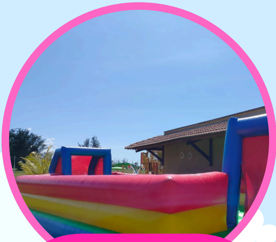
FUTEBOL 10,5COMP X 5LAR X 2,5ALT