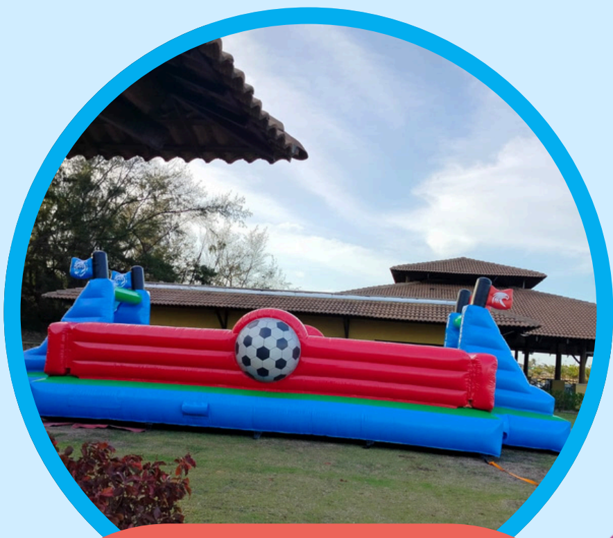
FUTEBOL MEGA 11,2COMP X 6,2LAR X 3,0ALT