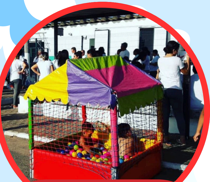
PISCINA DE BOLINHAS 1,5ALT X 1,10LAR X 1,10COMP