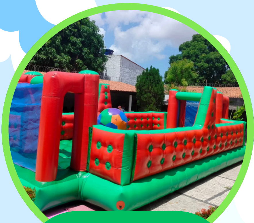
FUTEBOL/VOLÊI 2EM1 10,5COMP X 5LAR X 2,5ALT