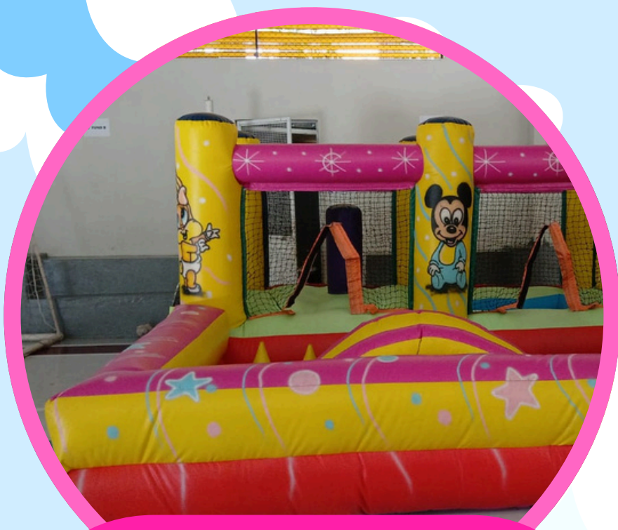
ESPAÇO BABY MULTIATIVIDADES 2ALT X 4,5LAR X 4,5COMP