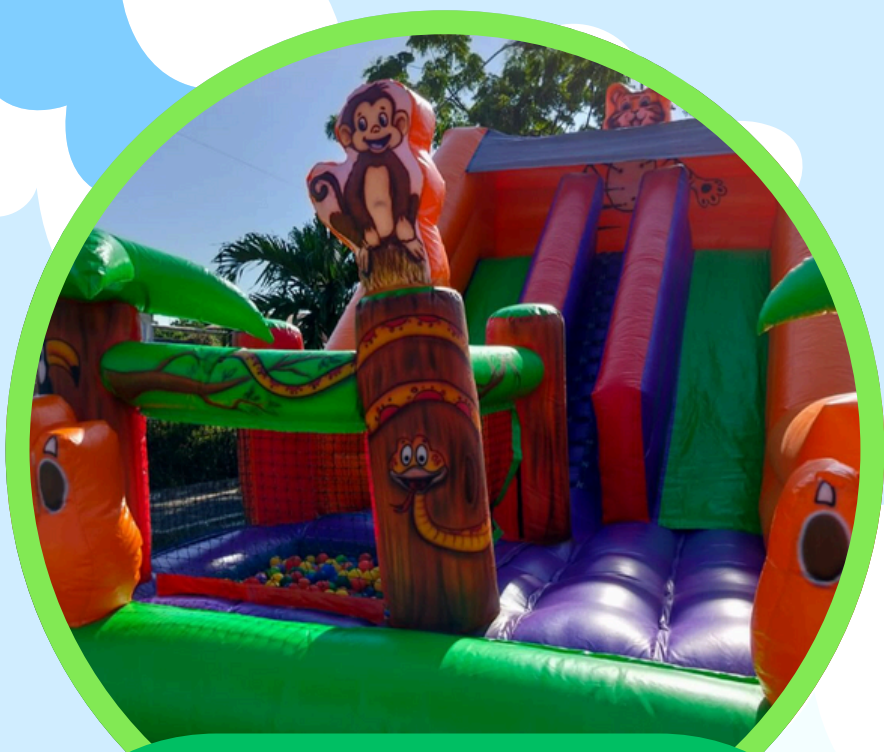
TOBOGÃ TIGRÃO SELVA COM PISCINA DE BOLINHA 5,5ALT X 4LAR X 8COMP