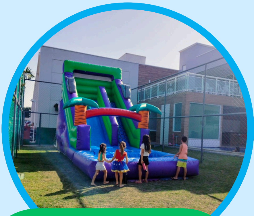
TOBOAGUA GOLFINHO COM PISCINA SPLASH 5,5ALT X 3,5LAR X 8COMP