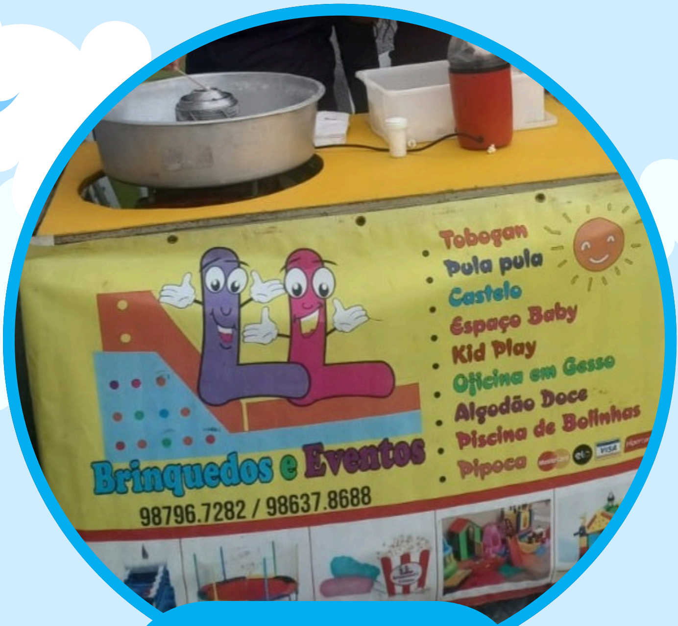
ALGODÃO DOCE E PIPOCA